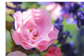
Klostergarten